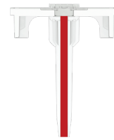
20 µL Kapillare