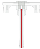
10 µL Kapillare